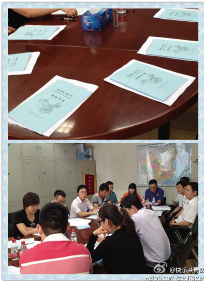
昆山陆家镇调研小组召开调研准备会

我期待着本周日和我们团一起去昆山更加近距离地感受昆山发展的不凡历程，更加深入地走进一线触摸这座城市的脉动，去找寻这座城市辉煌之困、发展之困、未来之路。