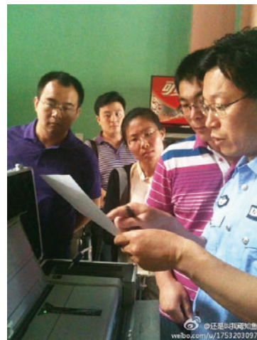
第一小队和执法队员进行例行网吧检查，对违规行为现场制作处罚单，现场打印签字。（青岛扫黄打非一线调研团）