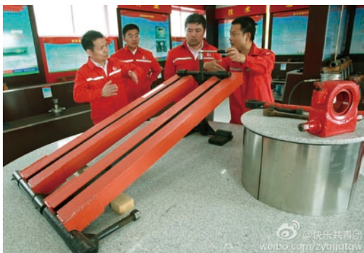
科技成果展览室中陈列着油田工人自己发明改进的机械设备，图中的设备是油田工人发明的旋转滑轨调节器，该设备可大大节省采油机电机皮带的换装时间，提高工作效率。该技术已获得实用新型专利证书。