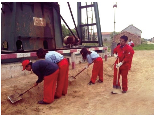
胜利油田调研团第三组在基层劳作。为石油事业出份力！（胜利油田调研团第三组）