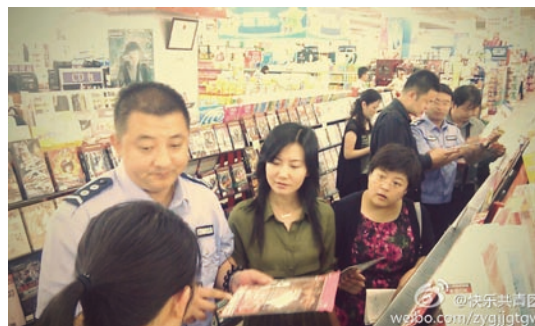
现场检查出版物市场，当前音像市场萎缩得厉害。（青岛扫黄打非一线调研团）