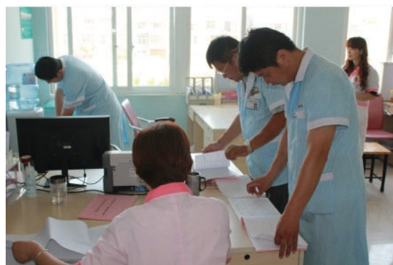
跟随服务站工作人员进行服务质量大检查。（安徽省亳州市蒙城县计划生育服务站调研团）