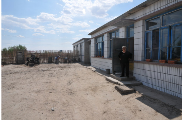
图2 与一些农村的拥挤不同，这里的房前屋后相当宽敞。屋子前的大块空地也没有用来种菜和养牲畜