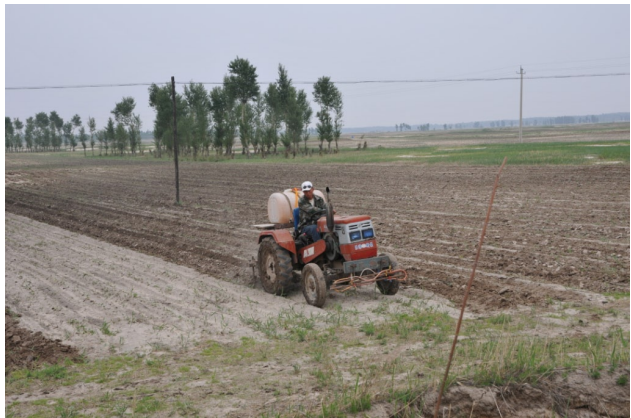
图3 人均耕种面积最大可达100多亩地