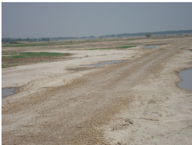
图4 土地整理项目，完工后仍然坑洼不平

但是实际情况是土地整理的效果有限。土地整理复垦开发是近年来国土资源部在补充耕地、保护耕地资源、提高农业综合生产能力、优化农用地结构方面的重要措施。西战村的土地整理项目方案是把盐碱土挖掉30公分，再用正常的土进行回填。几乎在村里访谈的每位村民都向我们表达了对这个土地整理项目的不满：土地整理后却并未平整，赶上下雨后，地里反而高低不平，拖拉机难以使用，严重影响了耕地效率。到底是方案问题，还是施工实施的问题，我们不得而知。