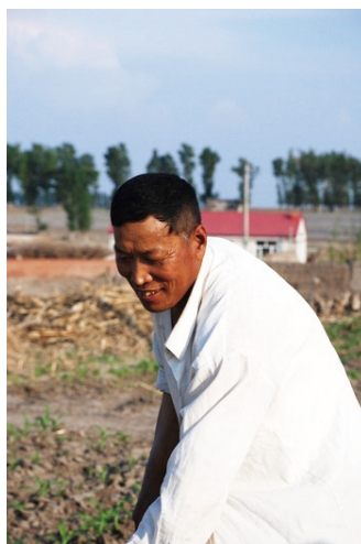
齐大爷在地里劳动着

芝麻没有出售。也有涨价的，比如蓖麻在2010年秋天的时候是3元一斤，到今年二三月份达到4元一斤。齐大爷不知道农产品的价格究竟是怎样的，如果全部都种一样东西，遇到价格波动较大时，很有可能发生大额亏损。在缺乏信息的情况下，最优的决策便是五样东西